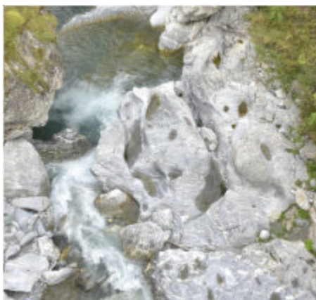
Titelbild - Unsichtbare Welten Ein „Steinwesen“, freigespült von der Gelia, bei Tiefenkastel, Graubünden, CH.