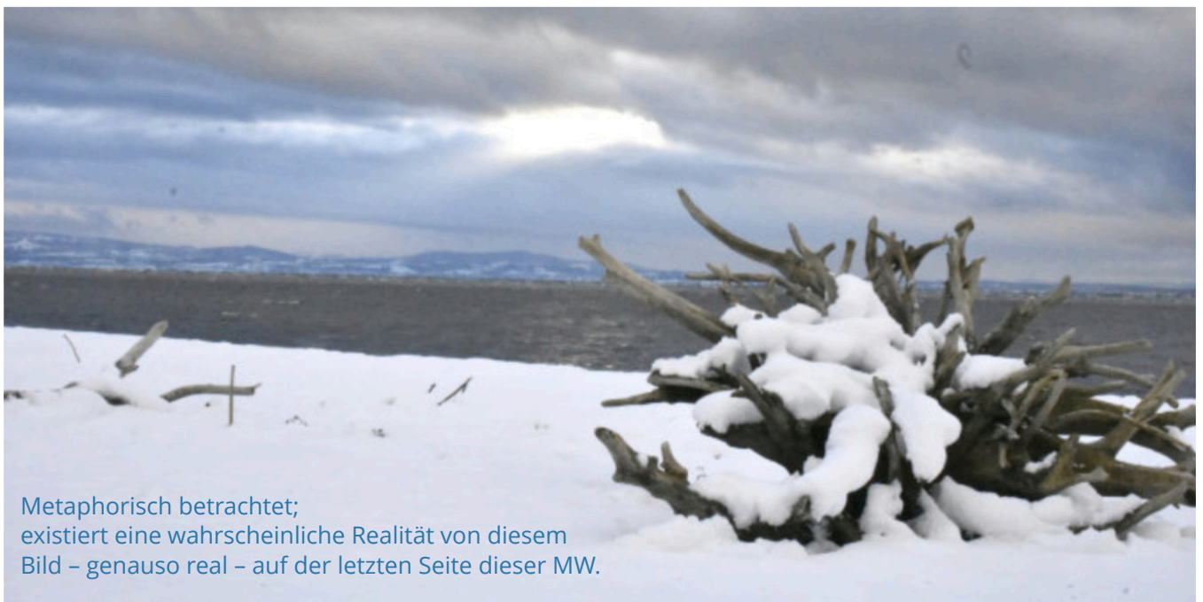
Metaphorisch betrachtet; existiert eine wahrscheinliche Realität von diesem Bild – genauso real – auf der letzten Seite dieser MW.

Diese Teile kann man sich aber bewusster machen. Bei außersinnlicher Wahrnehmung werden wir uns